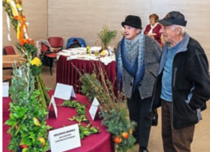
Razstavljene so bile butarice iz različnih slovenskih krajev.