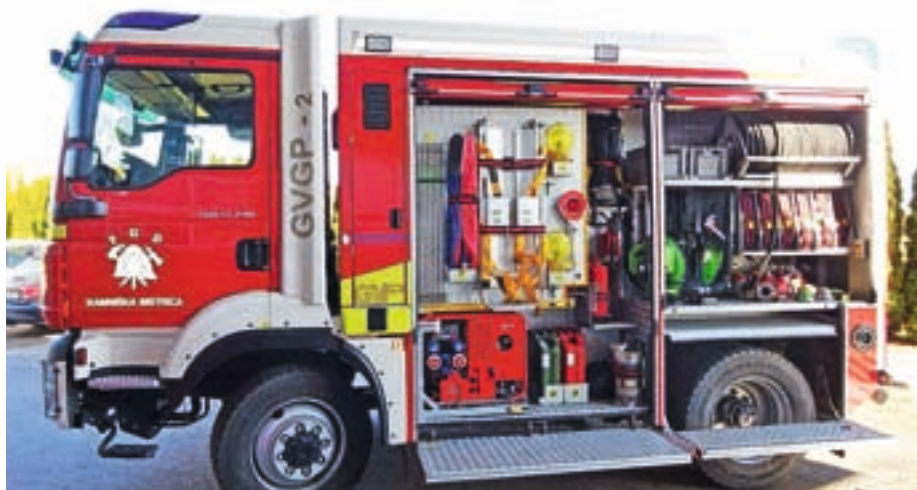
Vozilo za gašenje gozdnih požarov iz PGD Kamniška Bistrica

V občini Železniki je zelo velika poraščenost z gozdovi na celotnem območju. Gozdovi so tudi v zelo strmih in težko dostopnih območjih, od vzhodnega dela od Mohorja in Miklavža do zahodnega dela od Porezna do Soriške planine, pa od južnega dela od Starega Vrha, Koprivnika, Blegoša do Črnega Vrha in severnega dela z Dražgoško goro, veliko planoto Jelovico in Ratitovcem. V zadnjih letih postajajo izrazitejši tudi podnebne spremembe, ki predvsem v poletnem času prispevajo k povišanju temperatur in s tem pospešenemu izsuševanju tal, kar povečuje možnost pojava požarov v naravnem okolju. Ti požari so v zelo izsušenem okolju lahko siloviti, zato je tukaj nujno tudi izsekovanje gozda in preprečevanje zaraščanja v okolici vseh