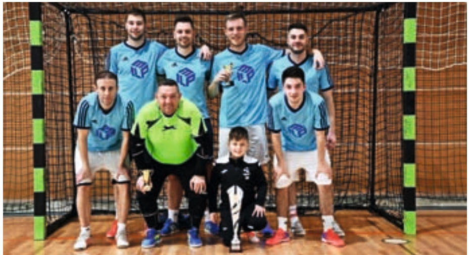
Ekipa Tim pile, zmagovalka lige v futsalu

Liga Selške doline v futsalu je potekala v štirih krogih, sodelovalo je osem ekip: Tim pile, Aston birra, Soršk, Panna, Vi-