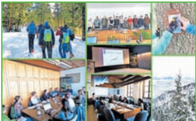
RAZVOJNA AGENCIJA SORA D.O.O., POLJANSKA CESTA 2, ŠKOFJA LOKA

Vse, ki želite biti obveščeni o aktivnostih ali vključeni v nadaljnje aktivnosti, vabimo, da obiščite spletno stran: https://www.ra-sora.si/projekt/jeloviza/ ali FB-profil Razvojnega agencije Sora ali se javite na e-naslov: anita@ra-sora.si .