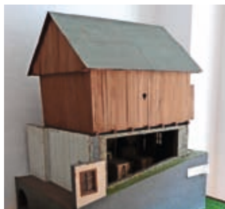
Maketa Mlinarjevega mlina na Češnjici v Muzeju Železniki

Mlinarstvo je bilo v Selški dolini še v sredini 20. stoletja zelo prisotno. Prevladovali so hišni mlini, nekaj je bilo tudi obrtnih. V muzejski zbirki z ma-