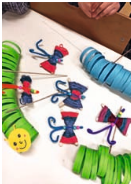
Mamicam za materinski dan

Mladinski center Železniki deluje pod Plavalnim bazenom Železniki že kar nekaj let. V njem so poleg mladinskega centra, ki deluje pod okriljem Javnega zavoda Ratitovec, tudi društveni prostori Kluba študentov Selške doline. Za svoje delovanje ga v zadnjem času precej uporabljajo tudi taborniki Rodu zelene sreče in druga društva, tako da so prostori res dobro izkoriščeni. Zelo dobro obiskan je mladinski center v torek, sredo in četrtek med 13. in 15. uro, ko pridejo osnovnošolci. Kot smo že večkrat dejali, je čas namenjen učenju in pisanju domačih nalog, vendar smo v vseh letih, kar delujemo na ta način, ugotovili, da mladi po koncu šole potrebujejo sproščeno druženje in zabavo ob igranju raznih iger, kar