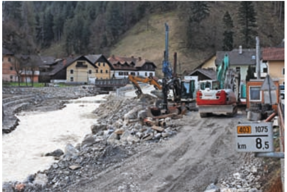
Izvajalcem protipoplavnih ukrepov na Selški Sori naj bi se v kratkem pridružili izvajalci, ki bodo gradili obvoznico mimo starega dela Železnikov.

Obvoznica bo umeščena na načrtovani levi obrežni zid Selške Sore, nanjo se bo priključil tudi novi most v Ovčjo vas. »Novogradnja vključuje križišča, opor-