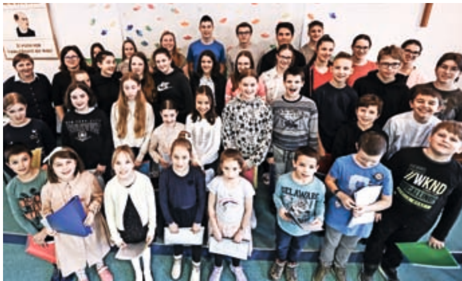
Skupinska fotografija vseh nastopajočih in organizatorjev

Najprej se nam je predstavil Otroški pevski zbor Župnije Selca, ki nam je pod vodstvom zborovodkinje Neže Pollak in ob klavirski spremljavi Nika Rovtarja v