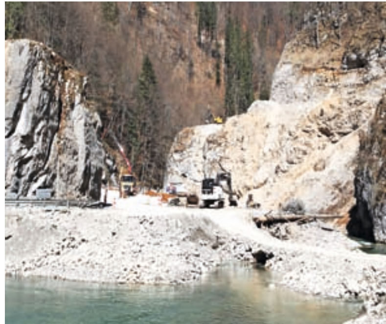
Gradnja na območju zadrževalnika pod Sušo

V zvezi s prvo fazo vodnih ureditev v Železnikih je župan povedal še, da je občina na drugem odseku Selške Sore od Domela proti Dermotovemu jezu ob gradnji kanalizacije izve-