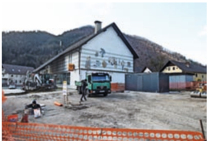
Gradnja tržnice naj bi bila končana do konca aprila.