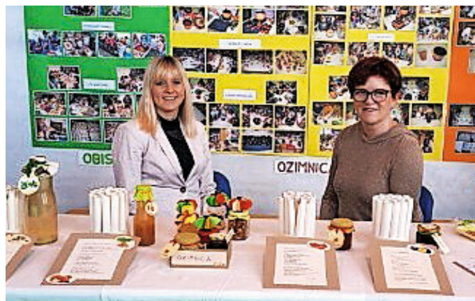
S predstavitve na Celjskem sejmu Altermed

Jeseni smo na obiskih v lokalnem okolju in pri kuharskih dejavnostih v naši igralnici spoznavali, da je najbolj zdravo uživanje svežih in presnih pridelkov. A teh je v izobilju le v jeseni, zato ostanek primerno shranimo ali predelamo v ozimnico. Skuhali smo paradižnikovo omako, slivovo marmelado, gosti sok iz jabolk in korenja ter sušili jabolčne krljice. Vse smo shranili v reciklirano embalažo. Pripravili smo male ozimnice, ki so jih otroci v zimskem času na različne načine porabili v domačem okolju. Iz melise in mete smo skuhalili zeliščni sirup, na delavnici peke na ekološki kmetiji Pr' Martinšk pa smo spekli medenjake. V prednovoletnem času smo strli orehe in zmleli jedrca, ki smo jih uporabili za nadev pri