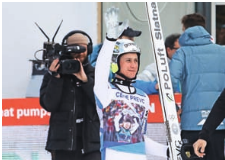
Cene Prevc je pomahal v slovo uspešni karieri.

Po tem, ko celo sezono ni skakal, je v soboto, 1. aprila, med serijama ekipne tekme s poslovilnim skokom na letalnici bratov Gorišek potrdil, za kako velikega športnika gre. Skorajda brez treninga je pristal pri 218,5 metra. V izteku so ga pričakali najbližji in prijatelji in ga popeljali v tekmovalni skakalni pokoj. »Bilo je približno tako, kot sem si zaželel. Poslovil sem se v Planici, ki je v zadnjih letih postala kar moj dom. Zadnji polet sem želel izpeljati dostojno. Upal sem, da bo šlo dlje. Ne morem iz svoje kože, vedno želiš boljše, dlje, hitreje, sploh pri skokih čim dlje. Na zaletni rampi sem odklopil okolico in se povsem osredotočil na skok. Če se ne bi, verjetno ne bi šlo prav daleč. Hvala