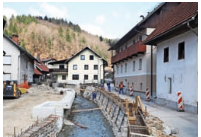
Po odstranitvi parapetnega zidu javna pot na Češnjici ne bo več tako ozka.

Protipoplavne ureditve vodotoka Češnjica so zajemale tudi ureditev struge v bližini objekta Češnjica 25, mimo katerega poteka zelo ozka javna pot, ki je nevarna za udeležence v prometu. Občina Železniki se je tako na pobudo krajanov odločila za odstranitev obstoječega parapetnega zidu ob novem obrežnem zidu vodotoka Češnjica, s čimer bodo pridobili ustrezno širino ceste med hišami. Dela, vredna slabih 27 tisoč evrov, izvaja podjetje HNG iz Ljubljane, končali pa jih bodo predvidoma do konca aprila. A. Š.