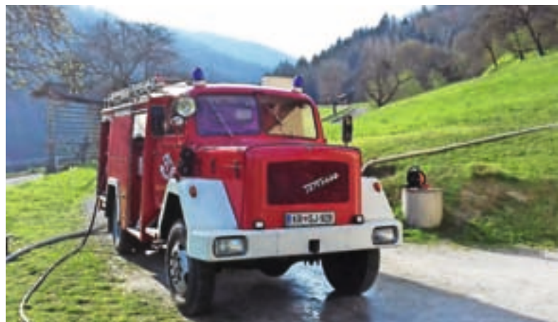
Gasilska cisterna TAM 5500 – GVC 16/45

Vozilo je bilo nabavljeno leta 1969, nadgradnjo je izvedlo podjetje Karoserist iz Maribora. Prva prenova gasilske nadgradnje je bila izvedena leta 1979. Leta 1984 je bilo obnovljeno podvozje vozila. Zamenjava nadgradnje vozila je bila izvedena leta 1985 v podjetju Karoserist, ki je tistega leta šlo v stečaj. Z osebnimi poznanstvi smo gasilci komaj dosegli, da se je vozilo dobilo nazaj, saj bi drugače pristalo v stečajni masi propadlega podjetja. Na vozilu je bil zamenjan tudi mehanski volan za hidravličnega. Na vožnji na požar leta 2006 je zago-